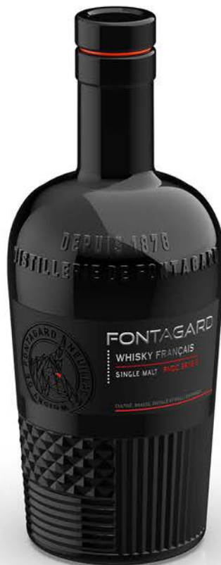
SINGLE MALT PNDC 9918-9