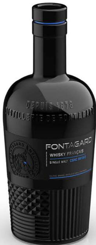
SINGLE MALT CGNC 9918-5

Fontagard, une distillerie de la région créée en 1878 qui est aussi l'une des plus belles si ce n'est la plus belle. Dix alambics, qui fonctionnent de façon traditionnelle, le labeur est certain mais la qualité n'a pas de prix.