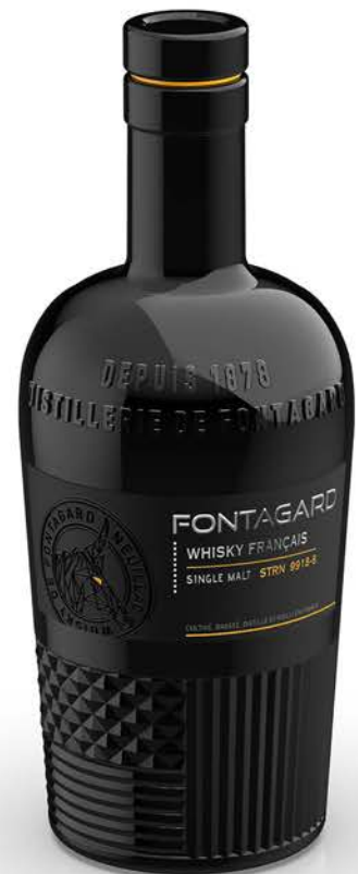
SINGLE MALT STRN 9918-8